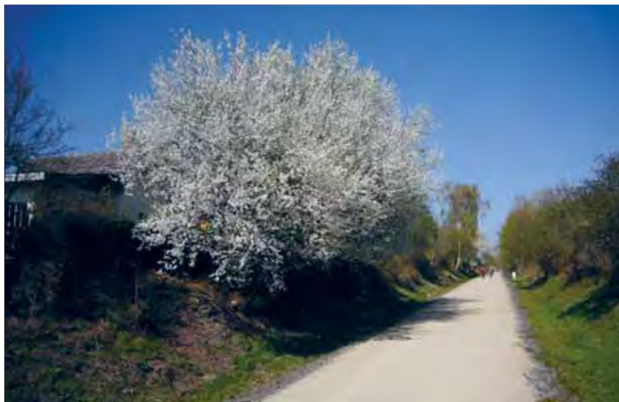
Braunschweig 2030: Das Ringgleis wird ein Rundwander- und Radweg sein, der Braunschweig umrundet und viele kleine, neue Betriebe und Gärten erschließen wird.

Das Magniviertel ist voller Leben, weil sich die Geschäftsinhaber auf Antiquitäten, Designartikel und Kinderspielzeug spezialisiert haben. Die Cafés und Kneipen sowie das zu