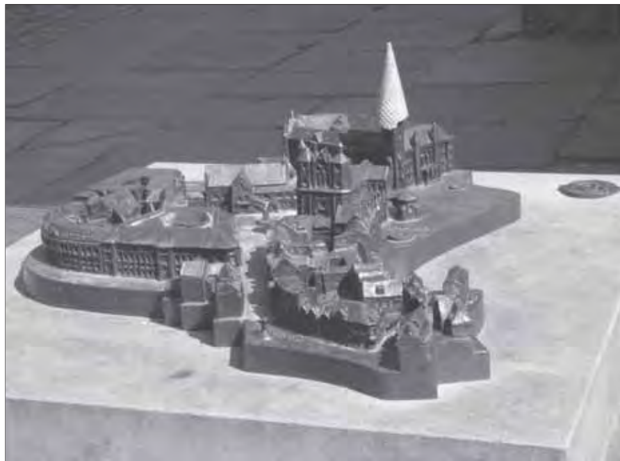
Ein neuer Deckel für das Rathaus – das braucht es buchstäblich, wenn Braunschweig nachhaltig saniert werden soll.

Im östlichen Ringgebiet wurden automatisch gesteuerte unterirdische Parksafes angelegt. Viele Straßen konnten dadurch zu Spielstraßen umgewidmet werden, da sie nicht mehr durch parkende Autos verstopft werden. Das westliche Ringgebiet erfreut sich immer größerer Beliebtheit. Hier gibt es im Bereich des