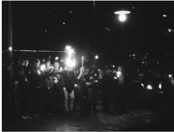
15.000 Menschen verteilten sich auf den 52 Kilometern der Lichterkette, die am 26. Februar 2009 vom Braunschweiger Kohlmarkt aus durch die Asse und Wolfenbüttel zum Schacht Konrad führte. Dicht gedrängt standen die Menschen im Wind und versuchten die Fackeln am Brennen zu halten.