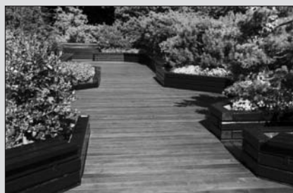
Sieht gut aus und ist aus heimischem Buchenholz: mit Thermoholz verlegter Gartenpfad.

Gut aussehende, dauerhafte Gartenmöbel sind heute meist aus – selten ökologisch gewonnenen – Tropenhölzern gefertigt. Doch seit einigen Jahren gibt es auf Basis einheimischer Hölzer eine Alternative, die es ästhetisch wie auch in Festigkeit und Haltbarkeit mit Tropenhölzern aufnehmen kann: das so genannte „Thermoholz“.