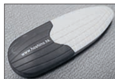
Aus Zellulose wird Polyactid gewonnen, mittlerweile gibt es ihn: den biologisch abbaubaren USB-Stick.

für beispielsweise Kunststoffe nicht mehr aus Erdöl, sondern aus Maisstärke gewinnen. Dabei wendet man einerseits die enzymatischen Verfahren der Biotechnologie an, andererseits aber auch klassische chemische Verfahrenstechniken.