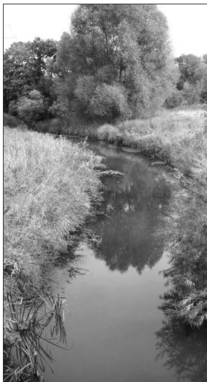
Die Schunter nahe Braunschweig.

Diese Sünden des zwanzigsten Jahrhunderts dürfen nicht verziehen werden, aber es ist durchaus möglich, Fehlentscheidungen der Vergangenheit zu korrigieren. Allerdings fehlt derzeit oft das Geld und hier in Nieder-