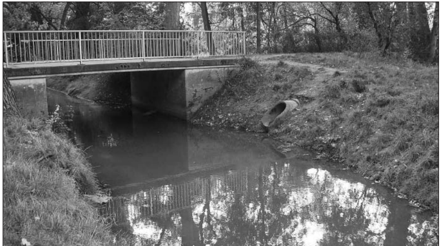
Nur ein Abwasserkanal ist derzeit die Mittelriede bei Braunschweig.

Da nicht vorausgesetzt werden kann, dass allen klar ist, warum ein nicht kanalisierter und nicht begradigter Wasserlauf vorzuziehen ist, sollten die Vorzüge kurz umrissen werden. Es gibt, grob gesehen, zwei Gründe, einen Fluss nicht zu kanalisieren: Der erste Grund ist die Verkürzung der Flusstrecke, was automatisch dazu führt, dass die bei starkem Regen anfallenden Wassermassen sich nicht verlaufen können und die Hochwassergefahr zwangsläufig steigt. Dann bietet ein begradigter Fluss aufgrund seiner uniformen Struktur nur wenig Varianz, was die möglichen Lebensräume betrifft. Alles sieht