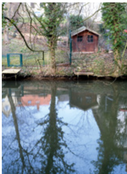
Wohnen am Ufer mit Gartenhang und eigenem Bootssteg – das kostet etwas.

Kein Wunder, dass wir auch am Wasser wohnen möchten. In Braunschweig ist das in erster Linie an den Okerumflutgräben möglich. Seit der ersten Lichtparcours-Ausstellung hat eine enorme Revitalisierung des Lebens auf und an der Oker stattgefunden. Vor allem vom Fluss aus konnte man die kunstvollen Lichtinstallationen am besten genießen. Die Oker wur-