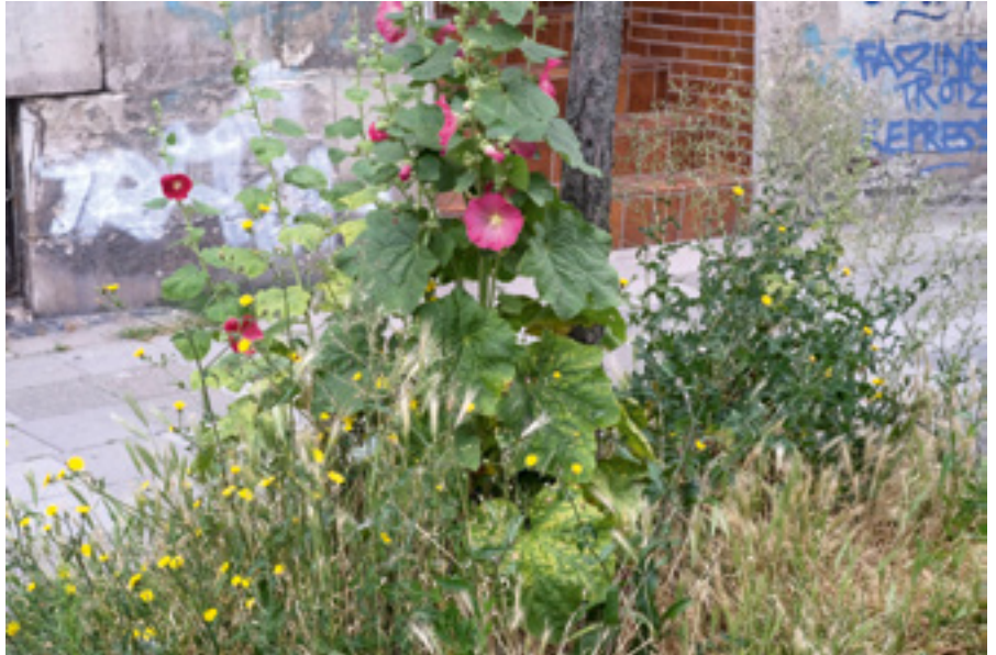
Eine Stadt lebt und blüht, wenn sich Menschen für Fortschritte engagieren. Ohne die Bürger läuft im Grunde nichts, oder nur in falsche Richtungen.

Dazu arbeitet der Verein mit staatlichen und nichtstaatlichen Organisationen und der Wirtschaft zusammen, um Fairness im Umgang mit unseren natürlichen Ressourcen und soziale Gerechtigkeit aktiv zu befördern. Er leistet Bildungsarbeit und engagiert sich bei einer Vielzahl von öffentlichen Veranstaltungen. Braunschweig Kaffee und Braunschweig Schokolade sind zwei exemplarische Produkte des fairen Handels, die der Verein vermarktet und die auch in den