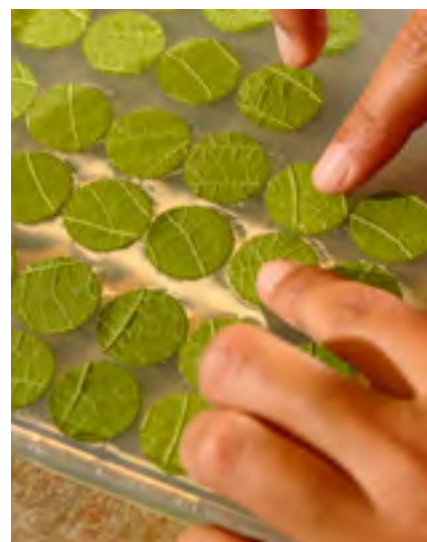
An Blatttrondellen von Reben, welche mit Pflanzen- und Pilz-Extrakten behandelt wurden, wird das Abwehrsystem der Pflanze gegen Krankheiten überprüft.

Die Ideen der Biopioniere waren von Jean-Jacques Rousseaus philosophischem Konzept des Einklangs mit der Natur geprägt. Im 21. Jahrhundert wird es aber ein modernisiertes Leitbild des Ökolandbaus brauchen. Nach wie vor werden der Mensch und die Natur im Zentrum stehen. Die größte Herausforderung wird aber die verantwortungsvolle Nutzung der ungeheuren technologischen Möglichkeiten sein. Diese Möglichkeiten lösen auch Ängste