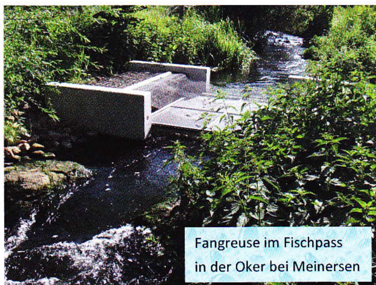
Fangreuse im Fischpass in der Oker bei Meinersen

Der vom NLWKN 2005 aufgebaute Fischpass hat erneut gezeigt, dass die Anlage für die zurzeit lebende Fischfauna in der Oker bei Meinersen voll funktionsfähig ist!