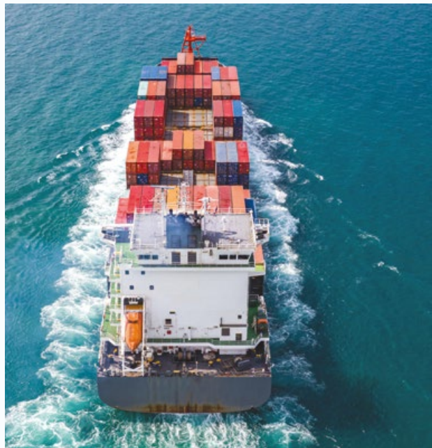
Warentransport mit Containerschiff.

kommt in den Polarregionen, den meisten Hochgebirgen und auch im arktischen Meer vor. Die Stabilität von Permafrost am Grunde des arktischen Schelfmeeres ist vor allem von der Wassertemperatur und dem hydrostatischen Druck abhängig. Viele Untersu-