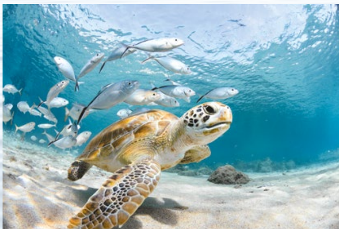
Grüne Meeresschildkröte ( Chelonia mydas ).

Die aktuelle Beschleunigung des Meeresspiegelanstiegs stellt daher grundsätzlich eine neue Situation dar und kann zur größten Herausforderung für Menschen und Ökosysteme werden. Insbesondere die Küstenbevölkerung in einigen Entwicklungsländern wie in Bangladesch ist von Flussüberschwemmungen nach starken Monsunregenfällen und Meeresüberschwemmungen durch tropische Wirbelstürme und den höheren Meeresspiegel doppelt bedroht. Steigt der Meeresspiegel um einen Meter an, dann würden rund 30.000 \text{km}^2 Land überflutet werden. Fast 15 Mio. Menschen wären betroffen. Bangladesch ist am stärksten betroffen, obwohl es am wenigsten zum Klimawandel beigetragen hat. Notwendige Anpassungsmaßnahmen müssen daher von der gesamten Staatengemeinschaft finanziert werden. Ebenfalls gefährdet sind Inseln und Staaten im Pazifik wie die Marshall Inseln, Kiribati, Tuvalu, Tonga, die Föderierten Staaten von Mikronesien und die Cook Inseln, im Atlantik Antigua und Nevis sowie im Indischen