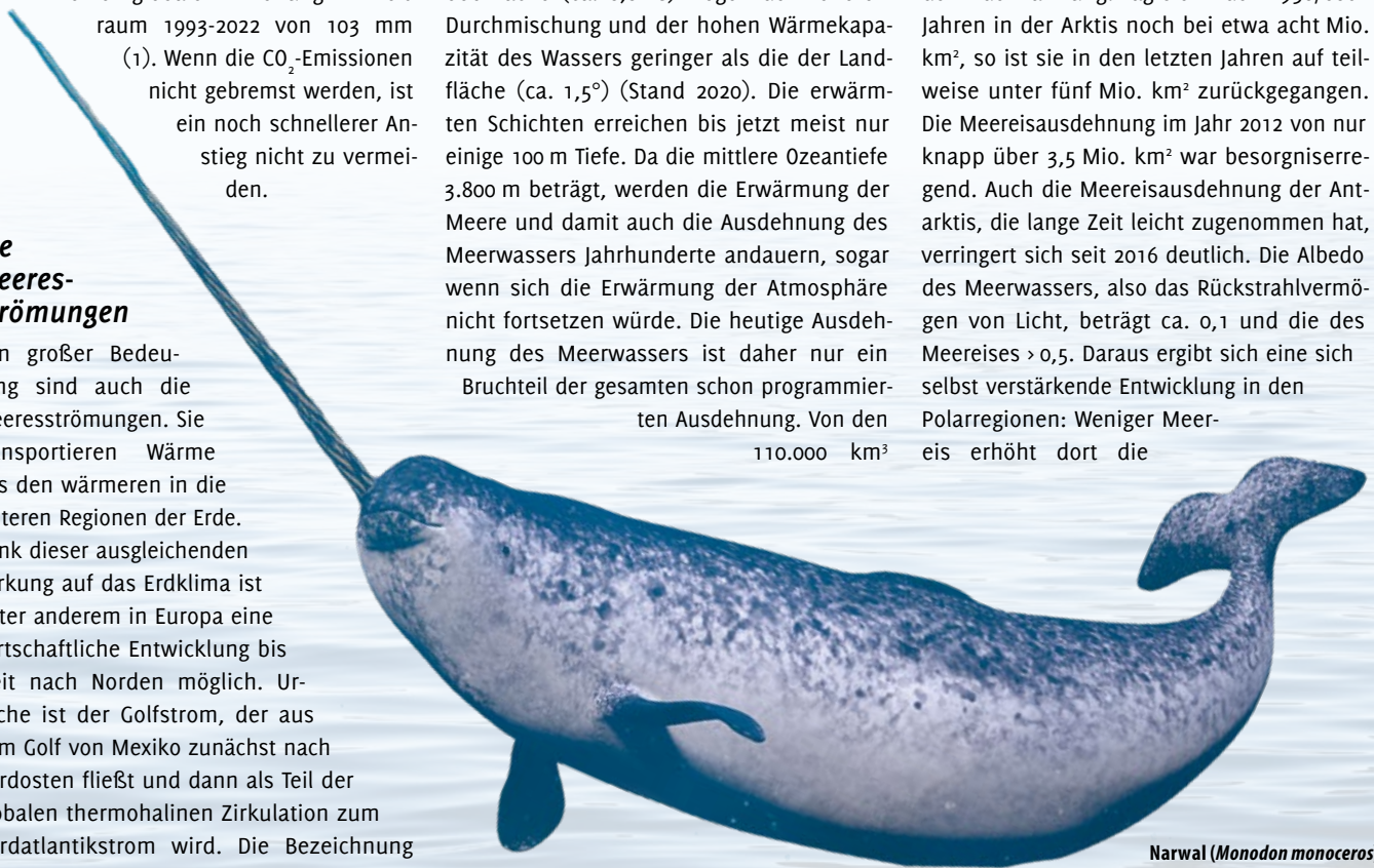
Narwal ( Monodon monoceros ).

Im Gegensatz zum Inlandeis auf Grönland und der Antarktis liegt auf großen Teilen der polaren Meeresregionen das Meereis nur als dünne Schicht. Es verändert das globale Klima weit über diese Regionen hinaus. Die Größe der am Ende des Sommers vorhandenen Fläche des Meereises ist ein Indikator für den Klimawandel und gilt als Barometer der Erderwärmung. Lag sie in den 1950/60er Jahren in der Arktis noch bei etwa acht Mio. km 2 , so ist sie in den letzten Jahren auf teilweise unter fünf Mio. km 2 zurückgegangen. Die Meereisausdehnung im Jahr 2012 von nur knapp über 3,5 Mio. km 2 war besorgniserregend. Auch die Meereisausdehnung der Antarktis, die lange Zeit leicht zugenommen hat, verringert sich seit 2016 deutlich. Die Albedo des Meerwassers, also das Rückstrahlvermögen von Licht, beträgt ca. 0,1 und die des Meereises > 0,5. Daraus ergibt sich eine sich selbst verstärkende Entwicklung in den Polarregionen: Weniger Meer-eis erhöht dort die